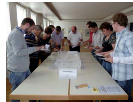
Dépouillement lors des élections municipales.

Avec deux femmes à l'exécutif, sans compter la vice-juge, Veyras rejoint la moyenne valaisanne de la représentation féminine dans les conseils qui s'établissait, en 2008, à 19%. Quoique modeste (quelques pourcents par an depuis l'an 2000), l'augmentation est régulière. On ne peut que s'en réjouir et encourager les femmes à participer à la gestion de la cité, à quelque étage que ce soit, assemblée primaire, commissions ou pouvoir exécutif et judiciaire.