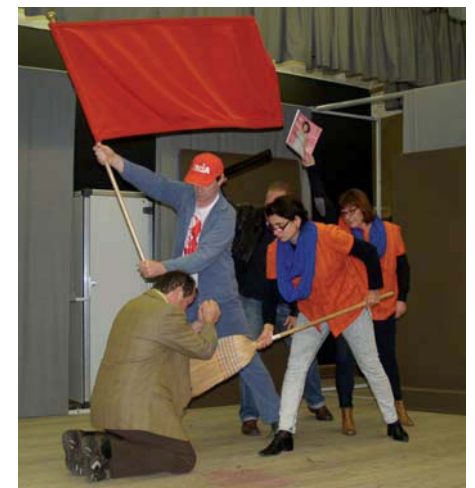
Les Baladingues en répétition.

La troupe jouera une dizaine de dates dans différentes salles du district: le 3 novembre à la salle de gym de Granges, les 9, 16 et 17 novembre à la Sacoche à Sierre, les 23 et 24 novembre à la salle sous l'église de Chermignon et enfin les 7 et 8 décembre à 20 heures 30 à la salle de gym de Veyras. Réservations chez Zap à Sierre au 027 451 88 66.